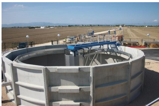
EDAR y colectores de Sant Jaume de Enveja (Tarragona).