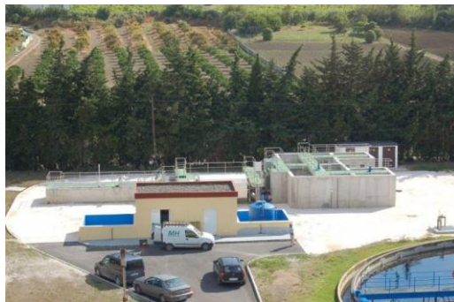
Terciario EDAR's Mijas y Manilva