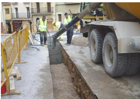
EDAR de la Horta de Sant Joan (Tarragona)