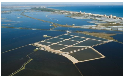
Reutilización de aguas residuales de la EDAR de Sueca