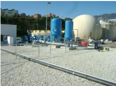
Instalaciones EDAR de Arroyo de la Miel (Málaga)