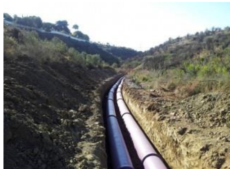
Instalaciones EDAR de La Víbora (Málaga)