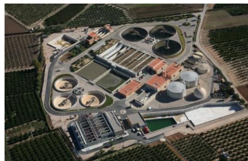
Instalaciones de la Albufera Sur (Valencia)