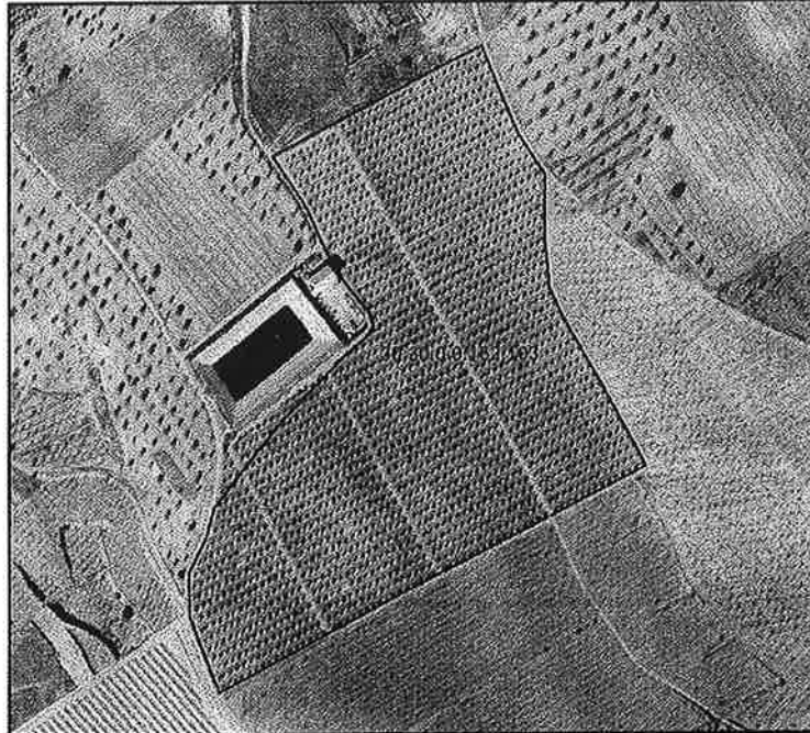
Polígono 162 Parcela 104