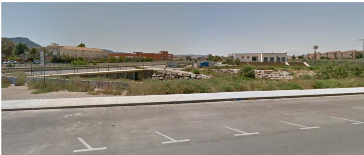
Foto. 2 Tanque de tormentas número 2