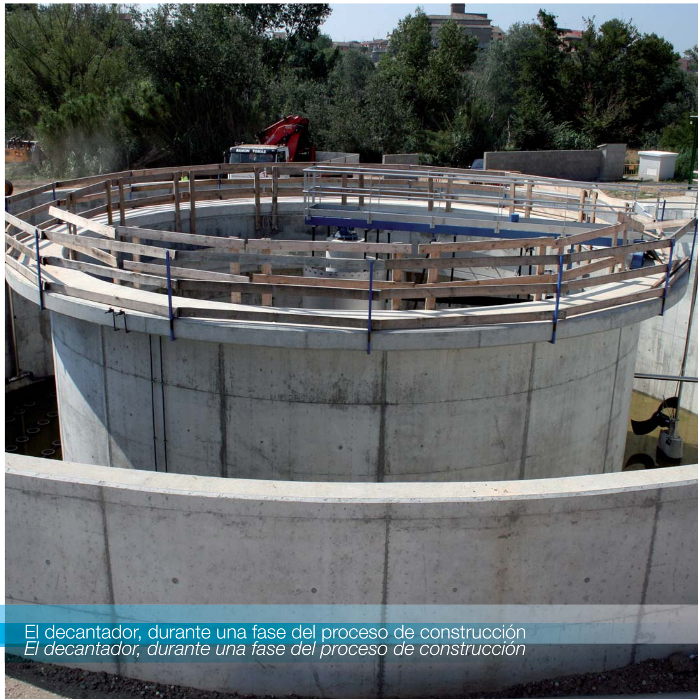
El decantador, durante una fase del proceso de construcción El decantador, durante una fase del proceso de construcción

Una de las actuaciones ya terminada es la Estación Depuradora de Aguas Residuales de Térmens y Menàrguens. Estas dos poblaciones, hasta ahora, únicamente disponían, como infraestructura de saneamiento, de una red de alcantarillado en baja en la que se vertían tanto aguas de riego como aguas residuales procedentes de polígonos industriales, descargándose directamente al río Segre sin ningún tipo de tratamiento.