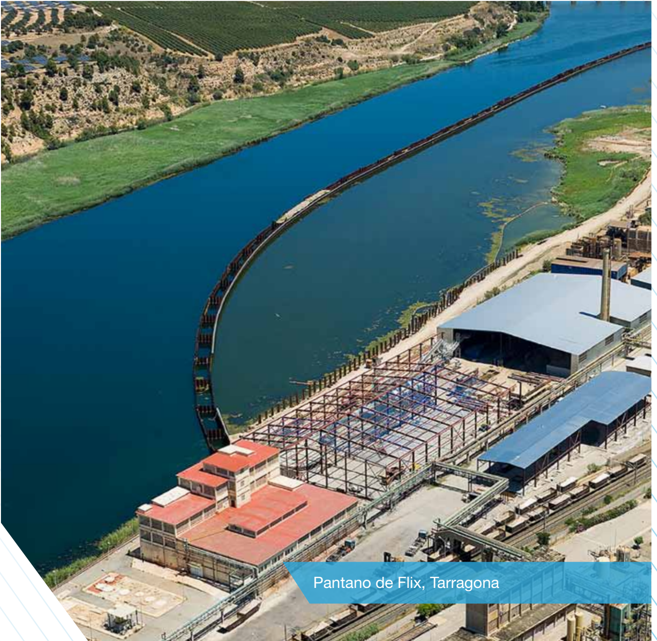
Pantano de Flix, Tarragona