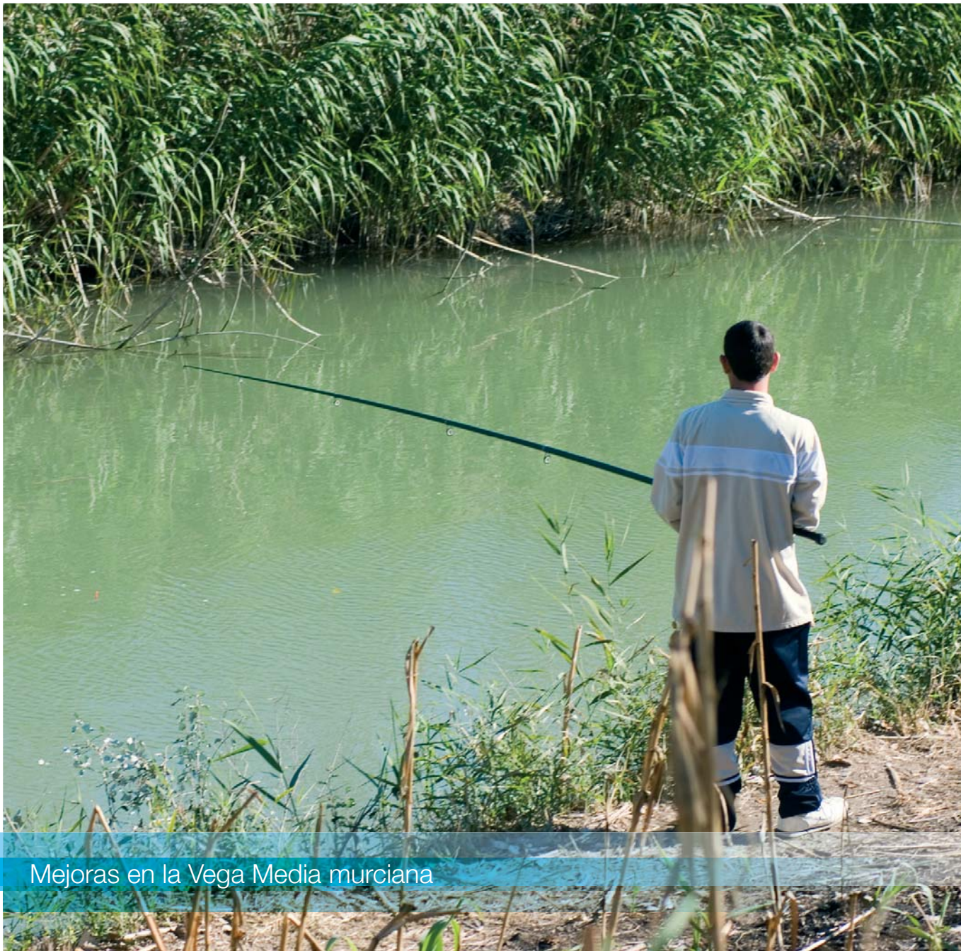
Mejoras en la Vega Media murciana

El Ministerio de Medio Ambiente, y Medio Rural y Marino ha dado un importante paso adelante hacia una política del agua en España que no sólo contempla infraestructuras hidráulicas más modernas y eficientes, sino que fomenta la implantación de nuevos criterios para mejorar la gestión y el uso de un recurso escaso. Esta política presta especial atención a los criterios de racionalidad económica y de sostenibilidad ambiental.