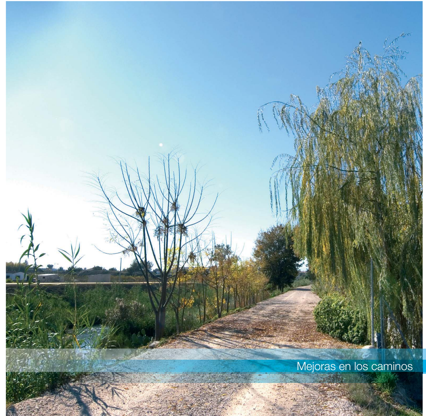
Mejoras en los caminos