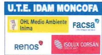
TABLA SUBROGACIÓN PERSONAL IDAM MONCOFA